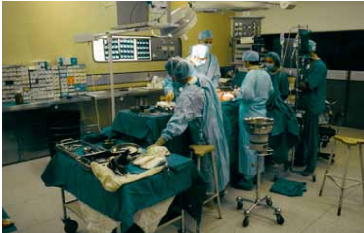
V operacijski dvorani UKC Ljubljana (1998).

Zagotovo je bil odločujoč očetov in pradedov kirurški zgled ali tradicija. Me je pa po končani fakulteti mikala tudi intenzivna