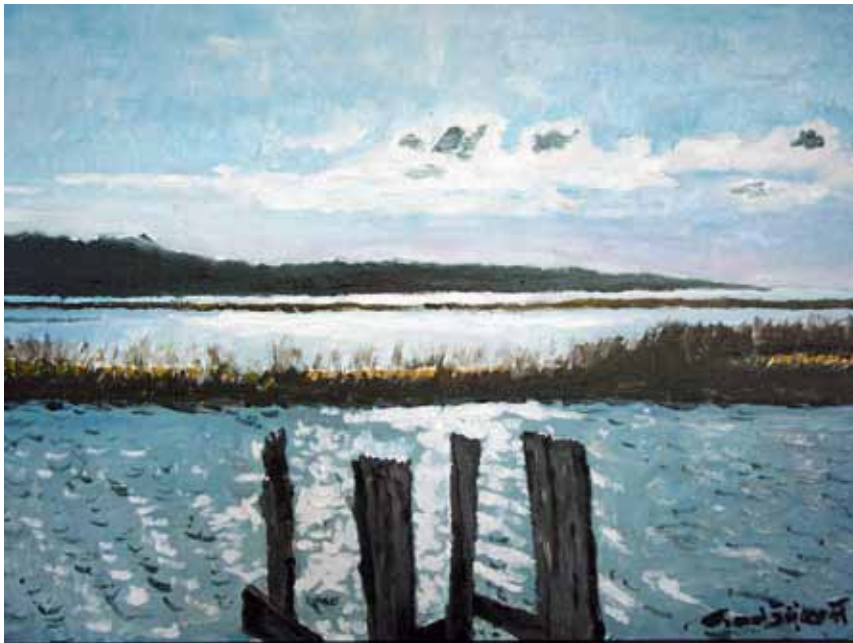
V Sečoveljskih solinah (olje na platnu, 30 x 40 cm).