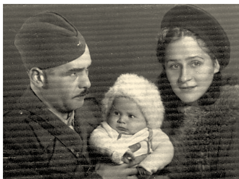
Oče, mama in jaz v svobodni Ljubljani.